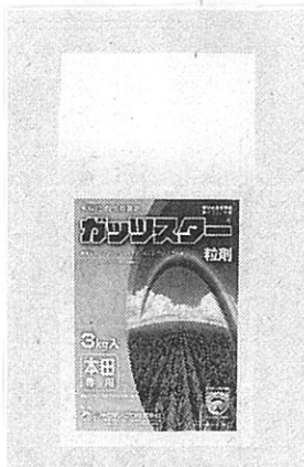
ガッツスター粒剤

今回トルプロカルブ成分を配合した「サンブラス」は、いもち病、紋枯病、稲こじ病、ウンカ類、ツマグロヨコバイ防除剤で、本田で使用。「サントリプル箱粒剤」は、いもち病のほか、もみ枯細菌病、コブノメイガ、ウンカ類、ツマグロヨコバイ、イネドロオイムシ、イネミスゾウムシ、ニカメイチュウおよびイネツトムシ防除剤として育苗箱で使用する。