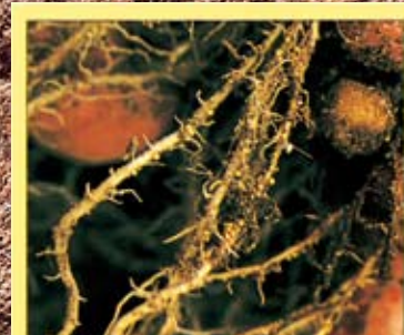
ジャガイモシストセンチュウ

*本製品は農業用殺虫剤であり、製品ラベルの記載内容以外には使用しないでください。 別段の表示が無い限り、®を付した商標は、米国デュポン社又はその関連会社の登録商標です。©2017デュポン・プロダクション・アグリサイエンス株式会社