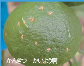
かんきつ かいよう病