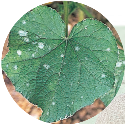
ハーモメイトの散布適期