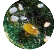
チャノホコリダニ