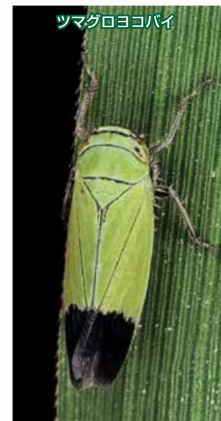
ツマグロヨコバイ