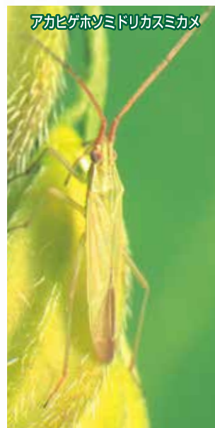
アカヒゲホソミドリカスミカメ