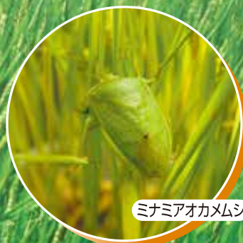
ミナミアオカメムシ