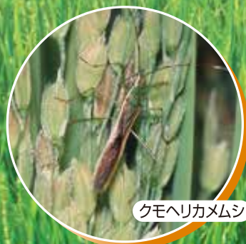
クモヘリカメムシ