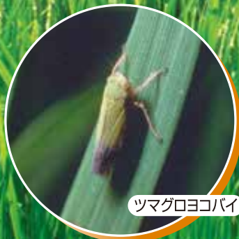
ツマグロヨコバイ