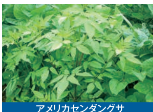
アメリカセンダングサ