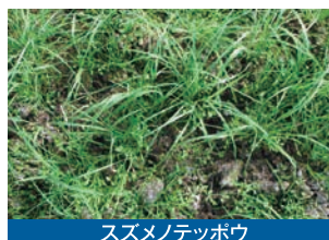
スズメノテッポウ